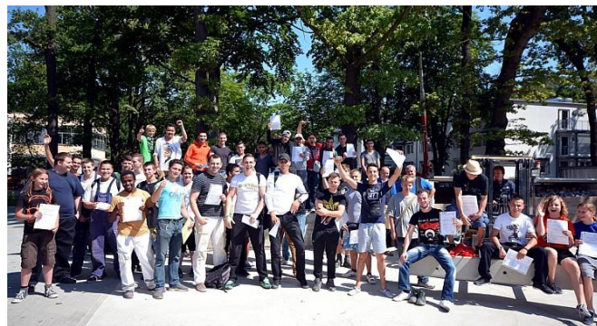
Foto von der BauCamp-Abschlussveranstaltung