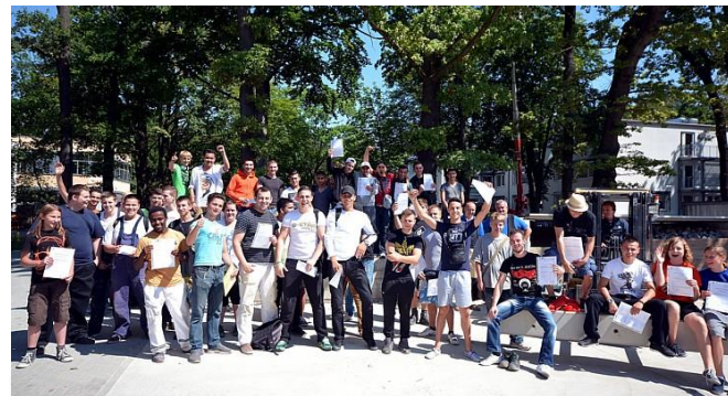
Foto von der BauCamp-Abschlussveranstaltung